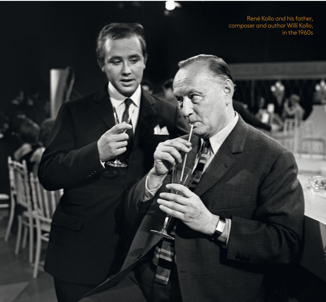
René Kollo and his father, composer and author Willi Kollo, in the 1960s

LOHENGRIN DIDN'T WANT TO WATCH OVER THE HOLY GRAIL, HE WANTED TO DESCEND TO HUMANKIND. NOR DO I FEEL CALLED UPON TO FOCUS EXCLUSIVELY ON GUARDING THE GRAIL OF GERMAN ART.